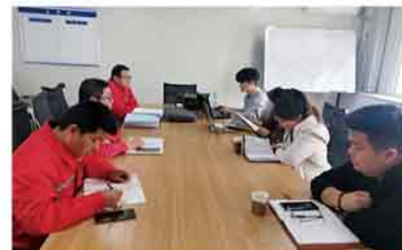
2月16日，省黄三角农高区生态环境分局领导陪同省环科院专家对公司开展了初始排污权现