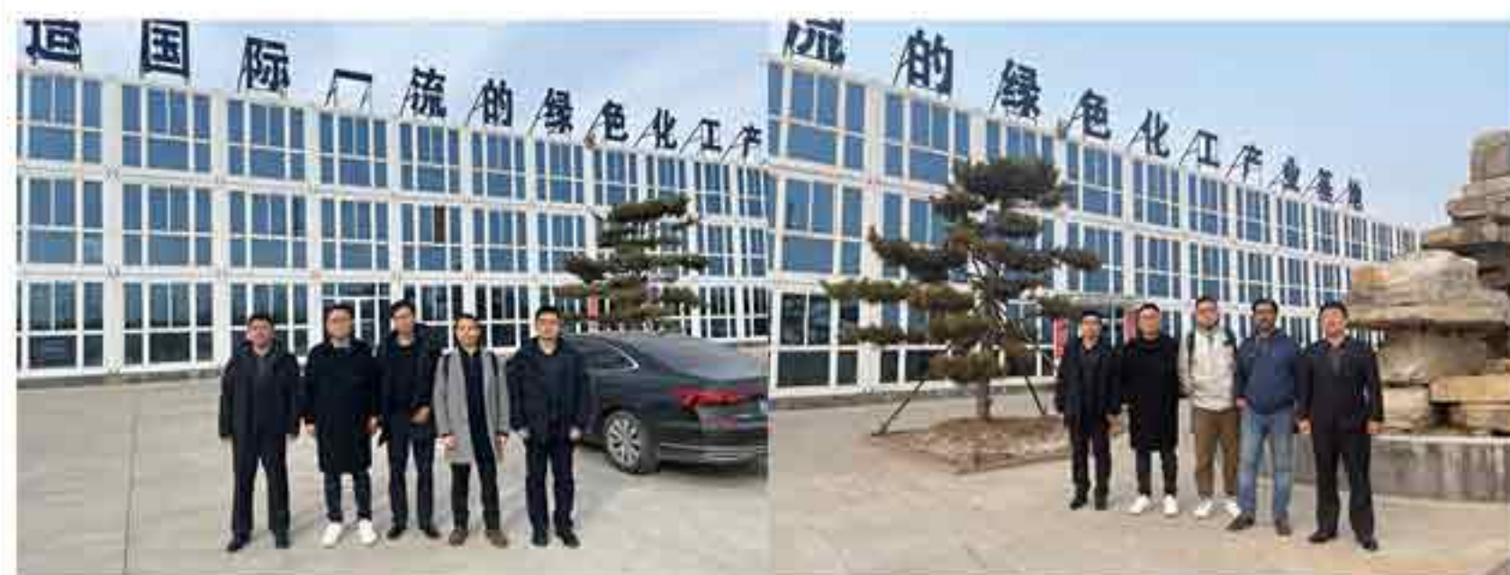
(来自日本的客户到公司考察交流)